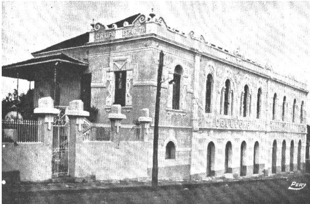
Aspect du bâtiment du Collège Allan Kardec en 1922, après sa réforme.

Le jour de l'examen, plusieurs personnes inhabituelles étaient venues. Le salon était