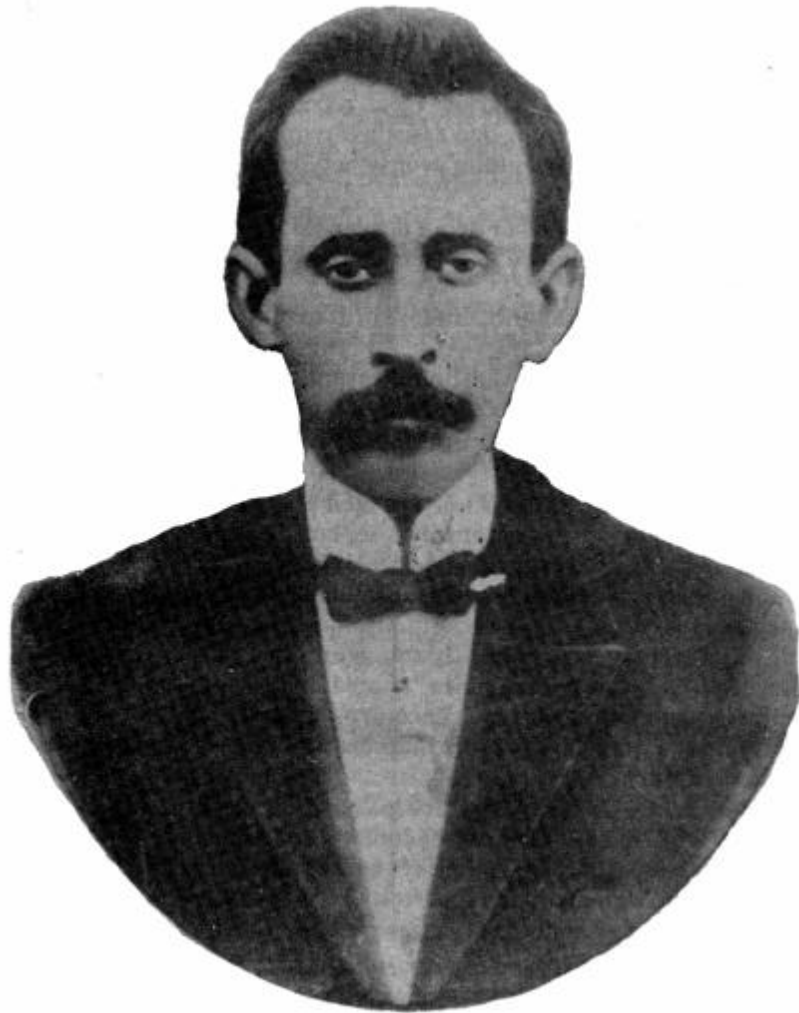
Ancienne photographie sans retouches montrant les traits physiologiques d'Euripide Barsanulfo.

Quelques jours plus tard, madame Francisca était allée passer quelques jours chez son fils