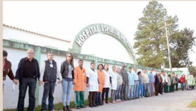
Fachada do hospital

Sanatório Espírita de Pelotas foi o nome inicial – Naquela época os pacientes eram recolhidos ao presídio municipal aguardando a passagem do trem de passageiros que tinham como destino à capital Porto Alegre, momento este em que os pacientes embarcavam rumo ao Hospital São Pedro e no fim, muitos permaneciam lá até o final de suas vidas. Entendendo que esta situação era um tanto preocupante, a Liga Espírita Pelotense reuniu esforços e solicitou a prefeitura da época a doação de um terreno para fundar o Hospital Psiquiátrico que se encarregaria de cuidar das pessoas nestas situações. O Hospital Espírita de Pelotas é uma entidade filantrópica, sem fins econômicos, fundado pela Liga Espírita Pelotense em 12 de dezembro de 1948 e inaugurado em 31 de março de 1956. Na fundação recebeu o nome de Sanatório Espírita de Pelotas, havendo em 1988, a mudança para o atual. Atua na área de saúde mental sob uma visão holística, biopsíquica, sociológica, espiritual, tendo como filosofia “Aqui o homem é visto como um ser total”. É, estatutariamente, permitida apenas a participação do quadro social, efetivo e da cúpula diretiva da instituição, de irmãos que pertençam ao quadro social de casas espíritas filiadas à Liga Espírita. Utiliza terapias convencionais e recebe pacientes de todas as classes sociais, sem considerar