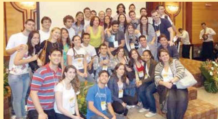
Jovens acadêmicos da AME Brasil

As evidências científicas nos oferecem cada vez mais motivos para nos dedicarmos ao estudo da inter-relação saúde-espiritualidade. São estudos com metodologias complexas, com grandes contingentes amostrais etc. Acredito que os meus anos de estudos em saúde e espiritualidade, reforçados pelas mudanças de atitudes e posturas pessoais e profissionais que já enxergo em mim, me fazem ter uma opinião mais 'complexa' a respeito desta importância. Tento passar a seguinte