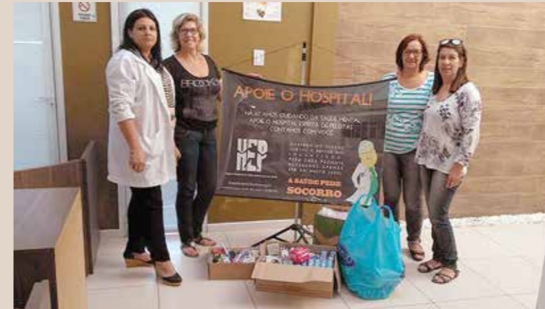
Voluntários do hospital em uma das campanhas

O hospital conta com atendimento multidisciplinar aos pacientes atendidos pela instituição como nutricionistas, psicólogos, psiquiatras, terapeutas ocupacionais, educadores físicos, entre outros. Já o departamento Espiritual foi criado fora do corpo do hospital, em espaço próprio, onde desenvolve todas suas atividades, não só doutrinárias, como também possui o seu setor assistencial, que cuida das principais necessidades dos pacientes, tanto materiais, físicas ou espirituais, todos desenvolvidos por voluntários da instituição. Os pacientes são convidados a participar duas vezes por semana do departamento, não sendo obrigatório, para que recebam orientações e também para receber o passe. Tais atividades são oferecidas à comunidade, porém em horários diferentes aos direcionados aos pacientes. É disponibilizada a