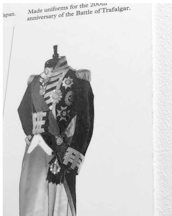
Costume comemorativo da Batalha de Trafalgar

de destaque no mundo, e os desenhos dos uniformes que servem à monarquia britânica. Como curiosidade, a roupa de