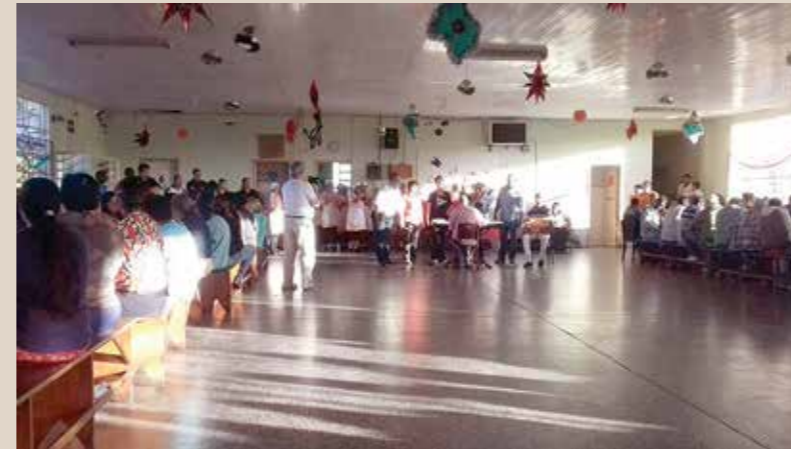
Vista parcial do salão principal da instituição

Um grito de socorro – Atualmente, o Hospital Espírita de Pelotas possui cinco unidades: uma voltada a pacientes do sexo masculino com transtornos psiquiátricos; uma unidade com pacientes do sexo masculino em situação de sofrimento oriundos do uso de álcool; uma unidade com pacientes do sexo masculino em situação de sofrimento oriundos do uso de drogas; uma unidade destinada a pacientes do sexo feminino com transtornos